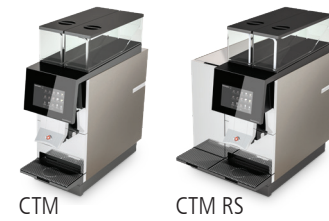
CTM CTM RS